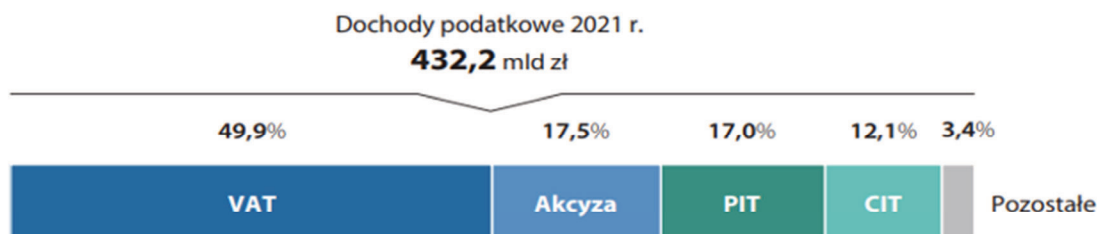
Wykres 3. Struktura dochodów podatkowych w 2021 roku